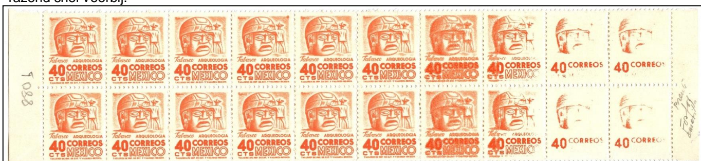
Een foutdruk uit Mexico; Tabasco een cacao regio waar Cortez voet aan wal zette.

Maart was eveneens goed gevuld maar de aanwezigheden waren uiterst laag, misschien was Witte donderdag geen geschikte dag. Nochtans een nuttig onderwerp was gepland; grijze, donkergrijze en zwarte zone in de thematische filatelie (volgens FIP reglementen). Met nog wat vondsten en enkele weetje vooraf ging de avond razend snel voorbij.