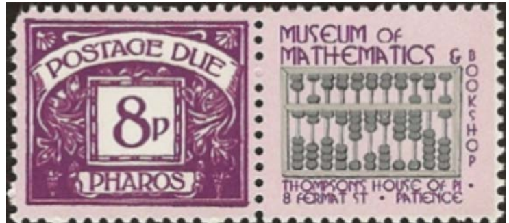
(3) Onderscheid cinderella's van postzegels!

Deze fase mag niet te lang aanlopen, want resulteert meestal in een overvloed aan stukken die later, wanneer de verzameling groeit en verbetert, in een schoendoos worden opgestapeld. Eens men merkt dat men met een "levenswerk" bezig is, is het aangeraden kieskeuriger te worden bij het aanschaffen van filatelistisch materiaal.