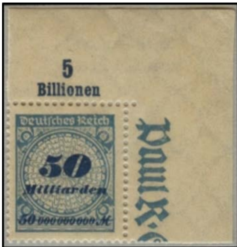
(2) Hoogste faciale waarde ooit uitgegeven op een postzegel: 50 miljard mark

Een thematische verzameling mag geen opeenhoping blijven van kleurrijke vignettes. Na verloop van tijd moet de verzameling groeien tot een volwaardig geheel met een behoorlijke filatelistische waarde. Dit wil zeggen dat er moet gestreefd worden om eveneens zeldzame enlof minder alledaagse stukken op te nemen. In de traditionele filatelie is het meestal zo dat "zeldzaam" nogal eens synoniem is voor "duur" of omgekeerd. In een thematische verzameling daarentegen kan een gewoon goed stuk, dat niet duur is, soms moeilijker te vinden zijn. Dit is het geval wanneer een bepaald stuk, noodzakelijk om een onderdeel van het gekozen thema te ontwikkelen, gezocht wordt voor de afbeelding of tekst of zelfs om het filatelistisch element zelf. Bijvoorbeeld het getal "5 biljoen" (afb. 2) thematisch uitwerken kan met filatelistisch materiaal zoals een hoekvelrand van een inflatiepostzegel met valuta 50 miljard uit het Duitse Rijk, uitgegeven op 22 november in het jaar 1923 en uit circulatie gehaald op 31 december 1923.